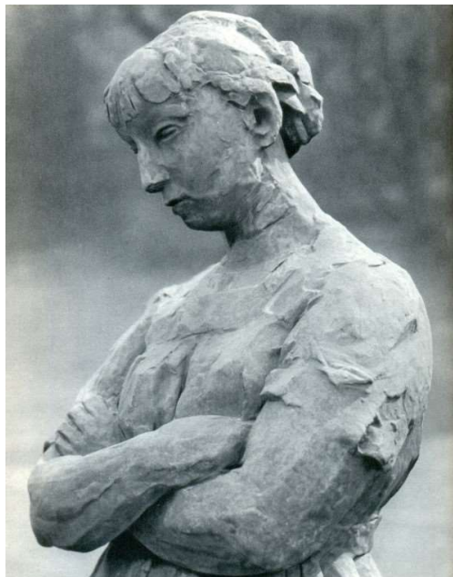
Detail van het beeld 'Huiselijke zorgen' (Rik Wouters – 1913 – Middelheimpark Antwerpen)