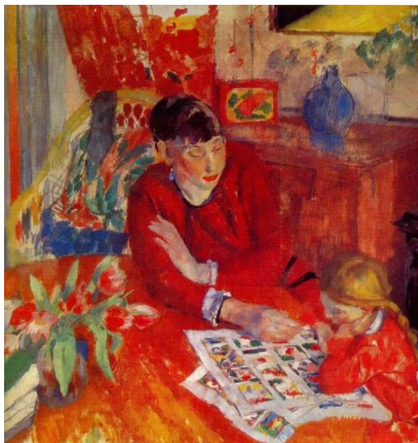
De opvoeding (Rik Wouters - 1912)